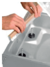
Barra de soldadura extraíble con dos resistencias. Doble sellado de la bolsa