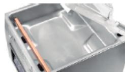
Cantos redondos para una fácil limpieza